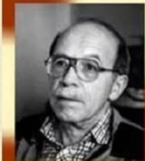
Михаил Гефтер (1918 - 1995)

Первый руководитель Центра «Холокост», выдающийся отечественный историк и философ