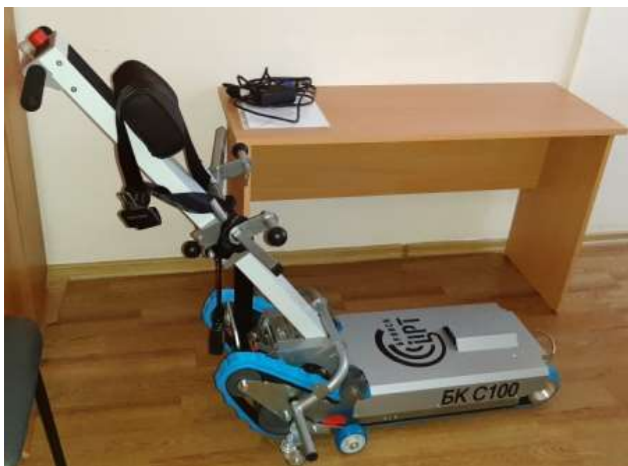
Подъёмник лестничный гусеничный БК С100