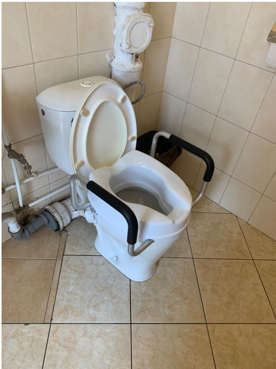
Сиденье-насадка для унитаза с поручнями для маломобильных групп населения