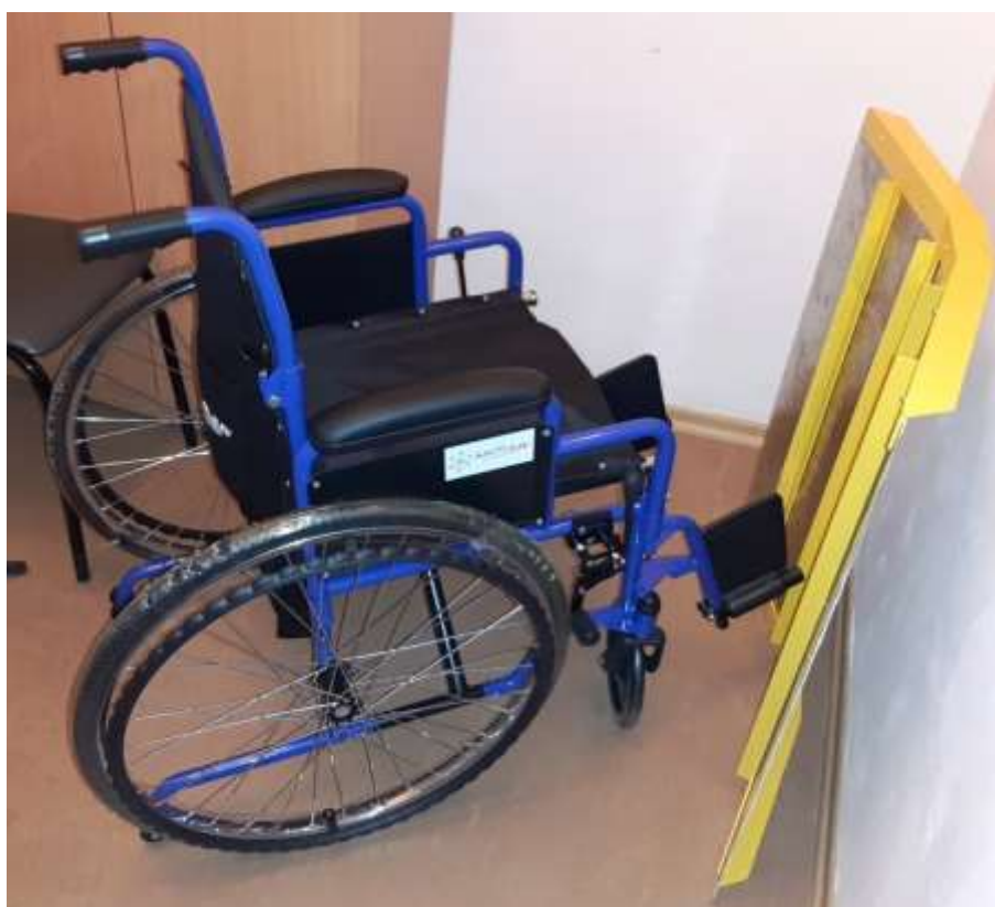
Инвалидная коляска универсальная H035 ТМ «Армед» и пороговый пандус