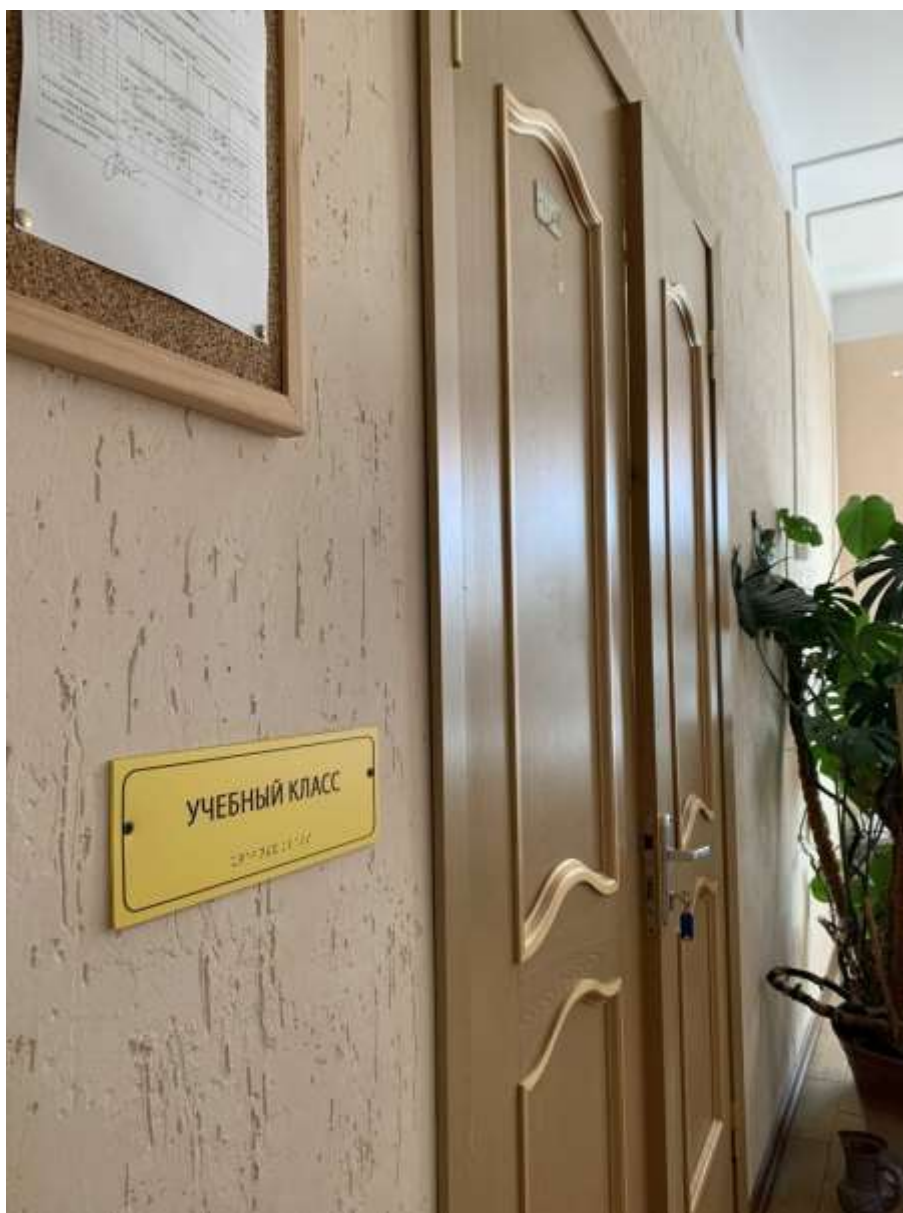
Зоны целевого назначения здания (целевого посещения объекта ) оснащены тактильной информацией со шрифтом Брайля