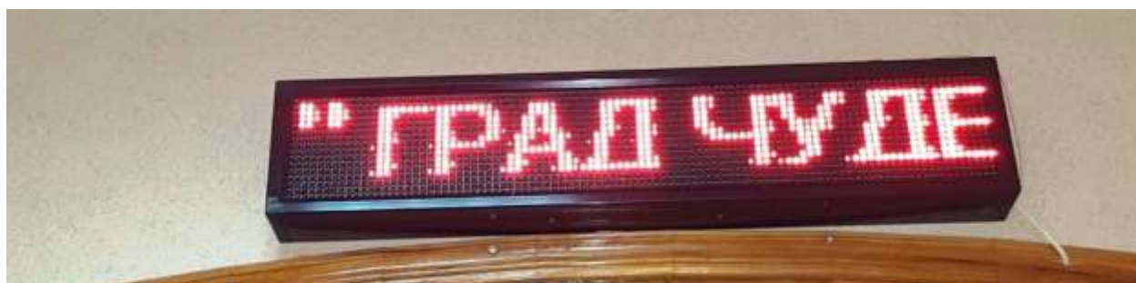
Над входной дверью установлена «Бегущая строка»- электронное устройство, предназначенное для отображения текстовой и графической информации.