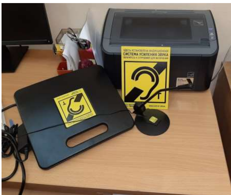
Система усиления звука