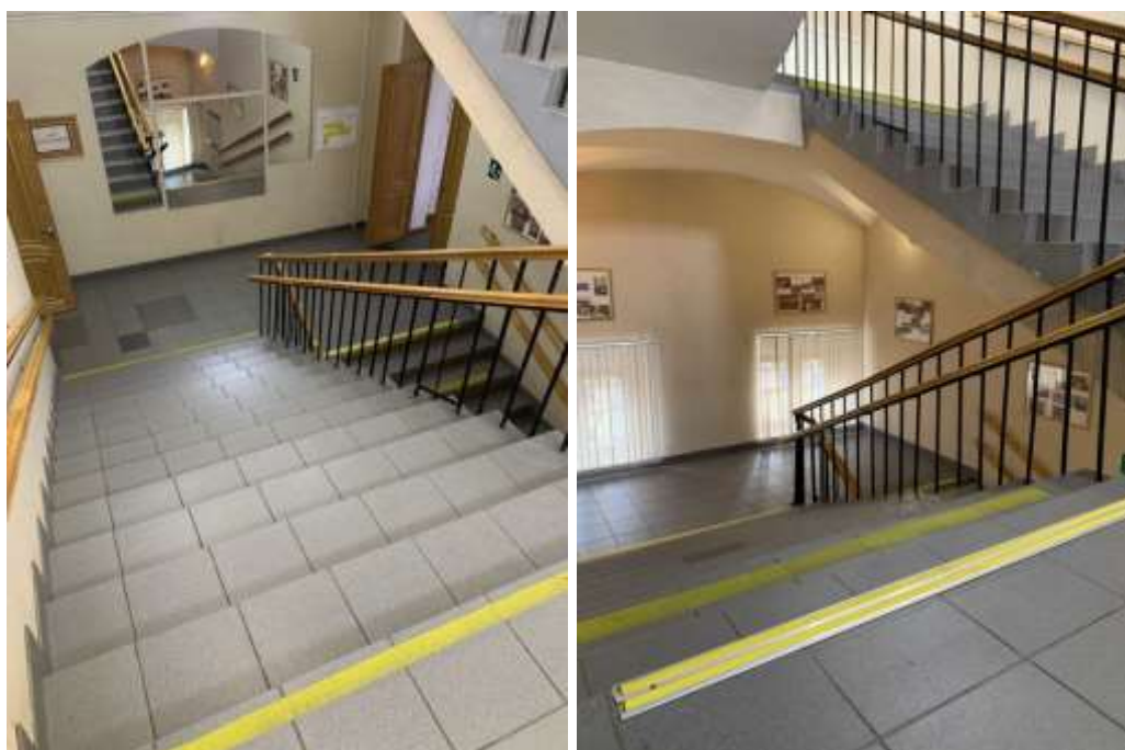
На краевые ступени внутренних лестничных маршей установлены металлические профили с противоскользящей резиновой вставкой контрастного жёлтого цвета