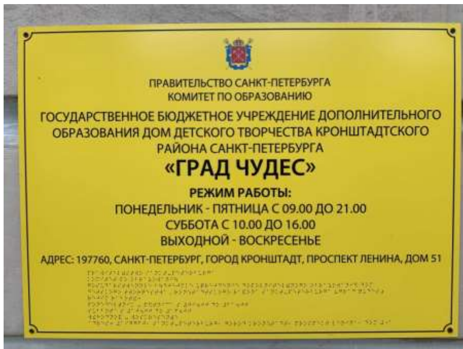
Вывеска учреждения с дублированием шрифтом Брайля