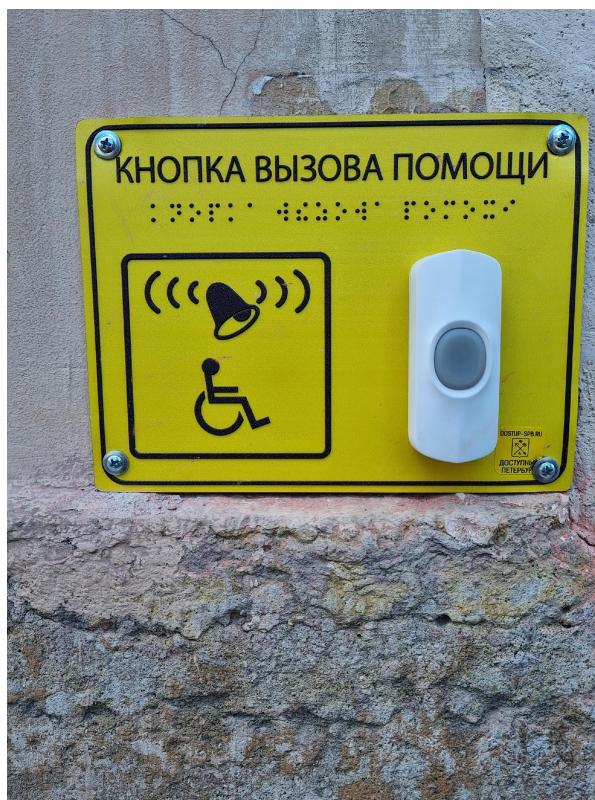
Кнопка вызова помощи