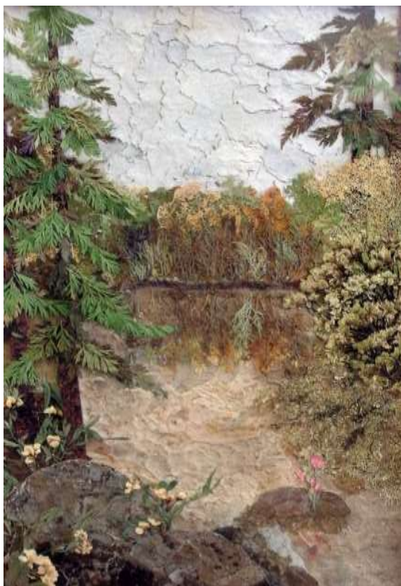
Огонёк над водой