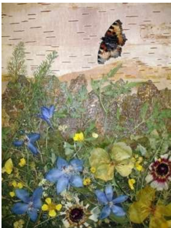
Летний день Илья М., 9 лет Материалы: береста, листья тополя, тысячелистника, дельфиниума, малины, цветки лютика, энотеры, чубушника, соцветия купыря.