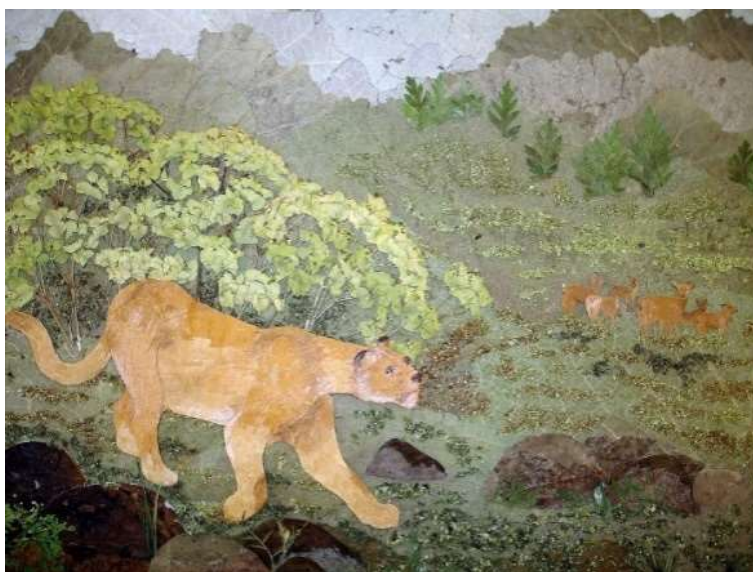
На охотничьей тропе Анастасия С., 14 лет Материалы: листья девясила, тополя белого, мать-и-мачехи, купыря, соцветия молочая, береста