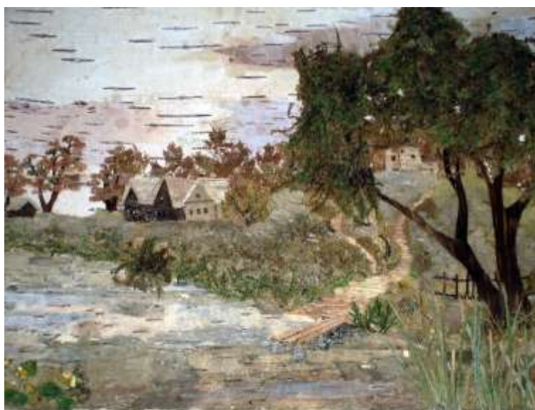
Хорошо и тихо Алиса Х., 14 лет Материалы: береста, листья малины, чубушника, лилейника, осоки, цветки лютика, мох