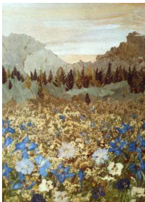
Голубая долина Анастасия М., 14 лет Материалы: обёртки кукурузы, листья мать-и- мачехи, тополя белого, купыря, чубушника, цветки купыря, дельфиниума.