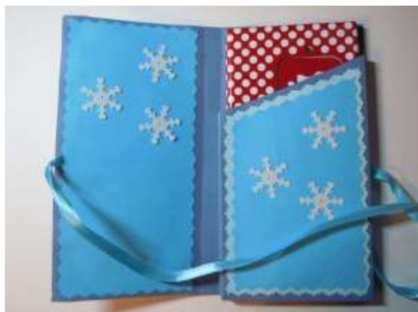
Шоколадница. Вариант 2.