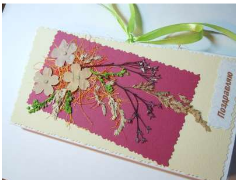
Шоколадница. Вариант 1.

Декорировать в зависимости от назначения шоколадницы. Выдержать под прессом (при необходимости). Приклеить карман.