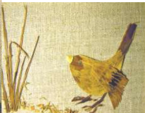
Воробей из подлистника

Приложение к теме «Аппликация из различных природных материалов - птица»