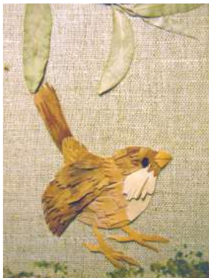
Воробей из бересты

Примечания: Чтобы птичка получилась «пушистая» кусочки подлистника (бересты) необходимо брать помельче и приклеивать только край. Птичку, сделанную из бересты, можно наклеить на деревянную поверхность (декоративную досочку, спил). С обратной стороны можно приклеить магнит или двухсторонний скотч.