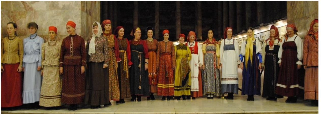
Участие в праздничных мероприятиях народного календаря