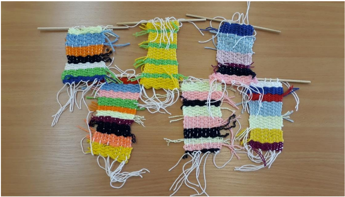
Ткачество на станке и бердо