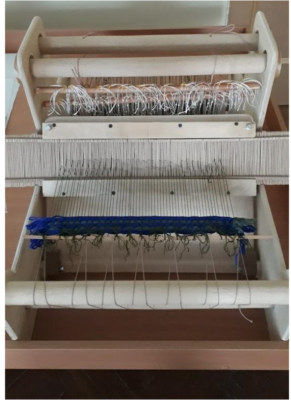
Ткачество на карточках