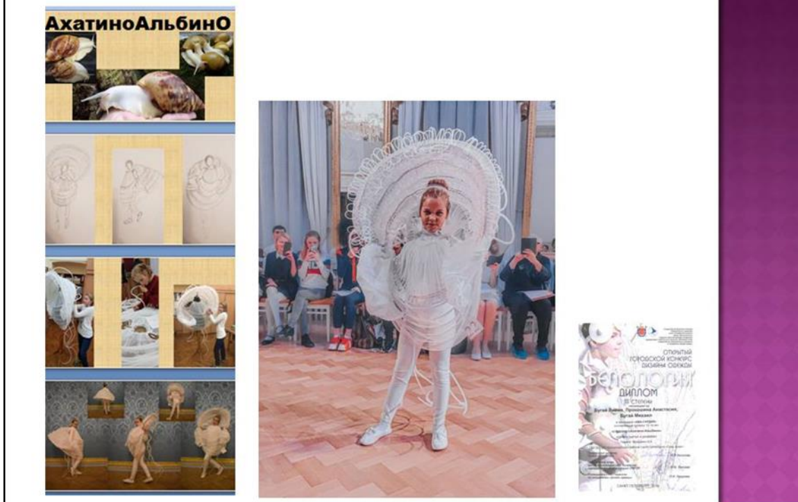
Рисунок 2. Коллективная модель для конкурса "Белология" из нетрадиционных материалов "АхатиноАльбино" Авторы: Бугай Лилия, Бугай Михаил, Прокошина Анастасия.