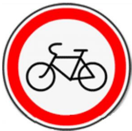
3.9 «Движение на велосипедах запрещено»

«Движение на велосипеде запрещено», «Велосипедная дорожка».