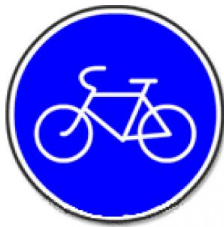
4 .4.1 «Велосипедная дорожка»