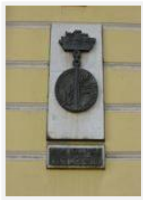
Знак за благоустройство Ленинграда, 1979 г.