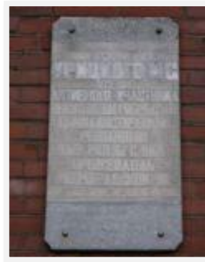
Доска, поясняющая название ул. Урицкого (ныне ул. Посадская)