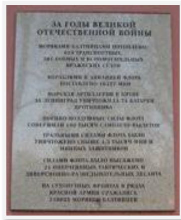
Доска «За годы Великой Отечественной войны...», 2000 г., Еськов А.И., Саксин И.М.