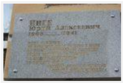
Доска Юрию Алексеевичу Инге, 1967 г.