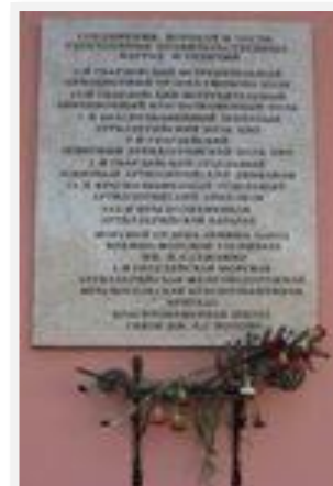
Доска «Соединения, корабли и части, удостоенные правительственных наград и отличий», 2000 г., Еськов А.И., Саксин И.М.