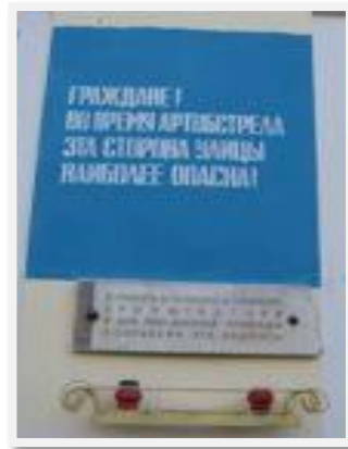
Доска, предупреждающая граждан об артобстреле, 1973 г., Ануфриев В.А