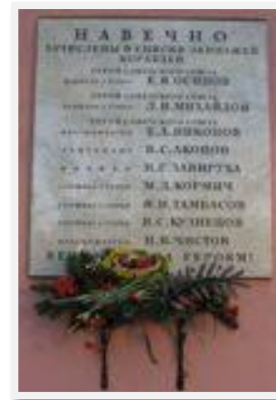
Доска Народным ополченцам, 1971 г.