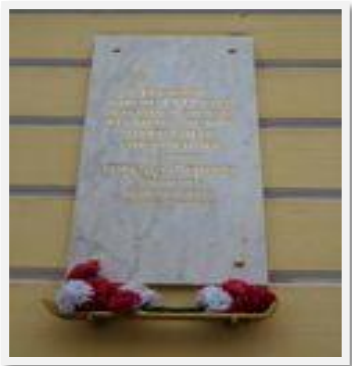
Доска Народным ополченцам, 1971 г.