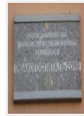
Доска на здании, где размещался эвакогоспиталь, 8 июня 1989 г.